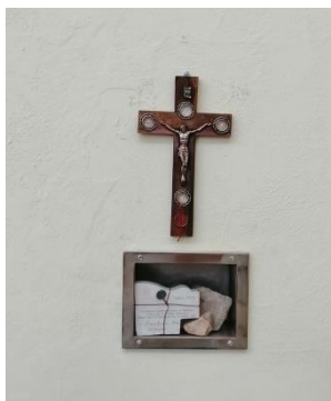
Kamień węgielny z grobu św. Piotra wmurowany przy wejściu do parafialnej świątyni

przerobiony na tablicę upamiętniającą ważne wydarzenia naszej parafii.