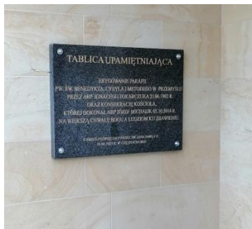
Tablica upamiętniająca erygowanie parafii i konsekrację kościoła